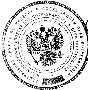
— А.Ю. Попова

3. Настоящее постановление вступает в силу с 01.09.2026 и действует до 01.09.2032.